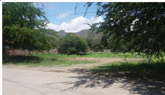
Imagen 2. Entrada al predio del proyecto