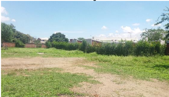
Imagen 1. Vista frontal del lote