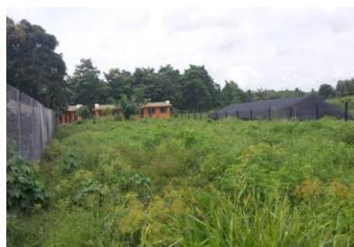
Imagen 2. Vista frontal del lote