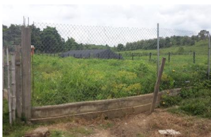
Imagen 1. Entrada al predio del proyecto