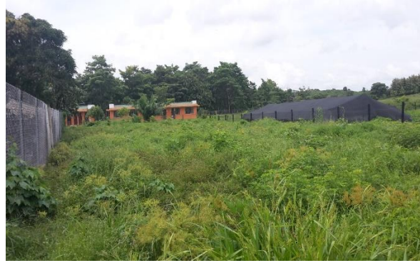
Imagen 2. Vista frontal del lote