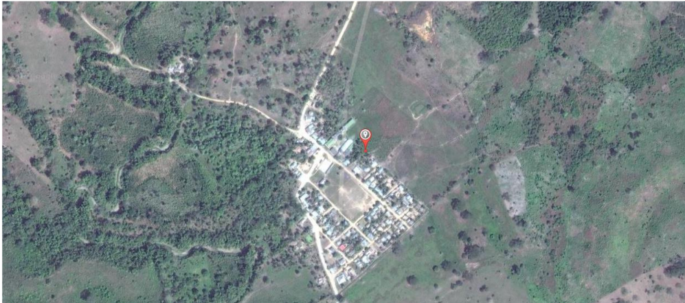
Figura 1. Localización Predio para la construcción del CDI