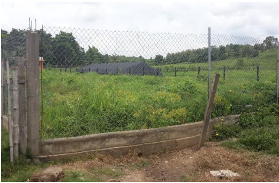
Imagen 1. Entrada al predio del proyecto