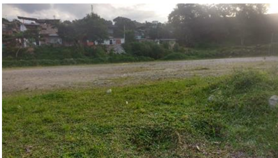
Imagen 1. Vista frontal del lote