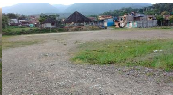
Imagen 2. Entrada al predio del proyecto