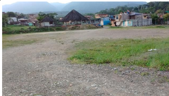
Imagen 2. Entrada al predio del proyecto