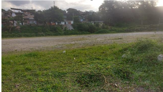
Imagen 1. Vista frontal del lote