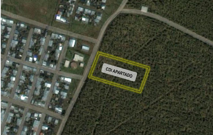
Figura 1. Localización Predio para la construcción del CDI

El acceso al proyecto se realiza por Cll.102C la cual está en pavimento rígido y tramo destapado de aprox. 100 mts en vía destapada sobre la Cra. 74.