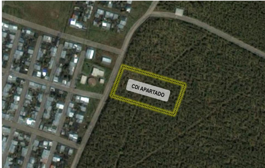
Figura 1. Localización Predio para la construcción del CDI

El acceso al proyecto se realiza por Cll.102C la cual está en pavimento rígido y tramo destapado de aprox. 100 mts en vía destapada sobre la Cra. 74.