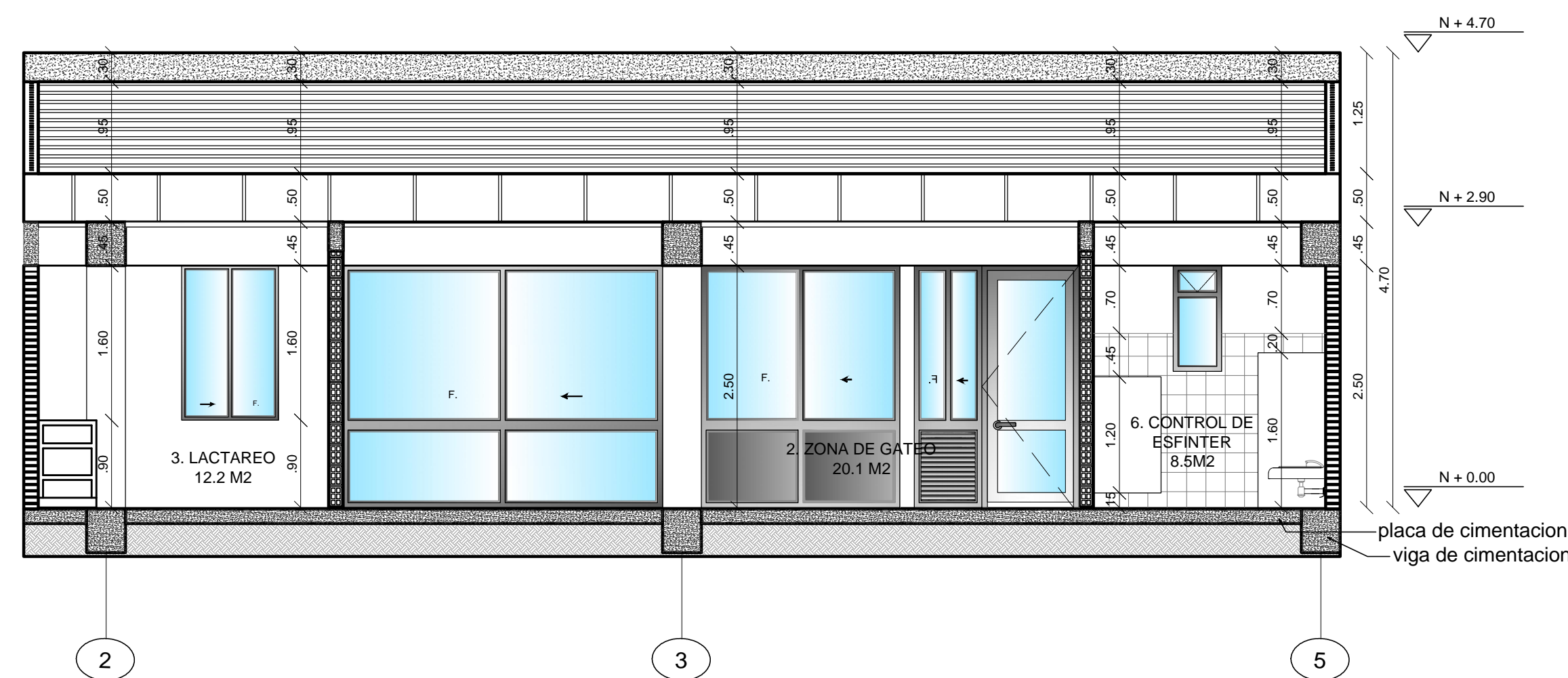
CORTE C - C ESC. 1:75