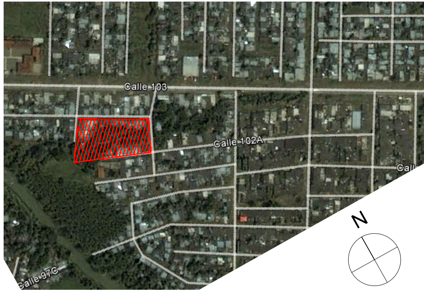
1. PLANO DE LOCALIZACION ESC. _____ SIN ESCALA