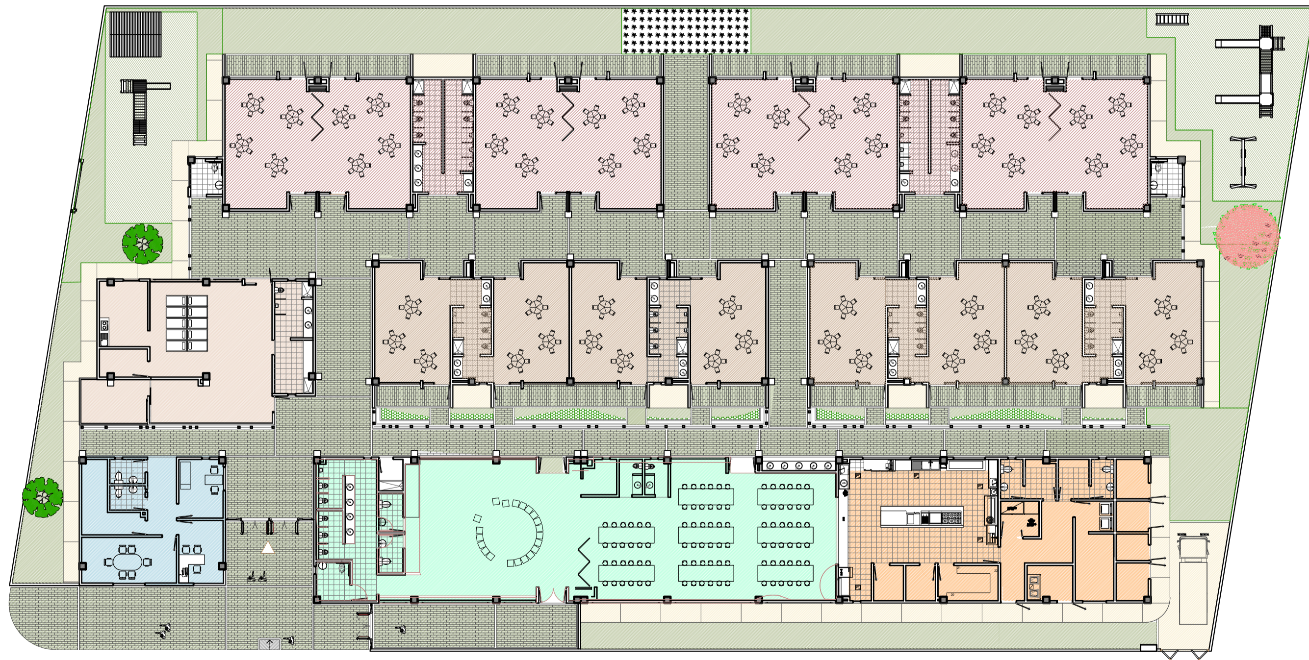
4. PLANTA GENERAL ESC. _____ 1:200