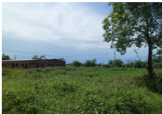
Imagen 2. Vista frontal del lote