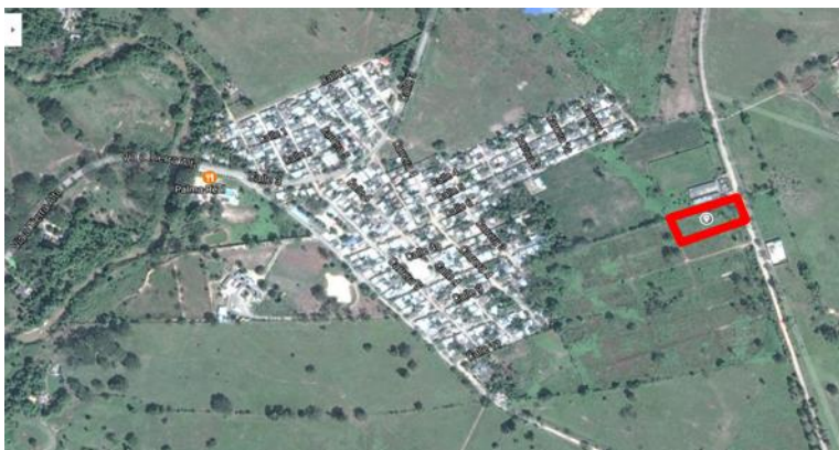
Figura 1. Localización Predio para la construcción del CD

Ubicación del Lote: El lote en el cual se desarrollará el proyecto corresponde al predio con matrícula inmobiliaria N° 140-90353 de propiedad del Municipio de Tierralta, con un área aproximada de 2.624 m 2 .