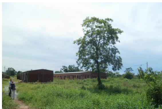
Imagen 1. Entrada al predio del proyecto