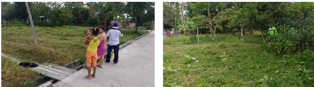
Localización General del Predio

Ubicación del Lote: El lote en el cual se desarrollará el proyecto corresponde al predio con matrícula inmobiliaria N°400-644 de propiedad de la comunidad indígena Ticuna Huitoto, ubicado en el kilómetro 6 de la vía Leticia – Tarapacá, Leticia – Amazonas.