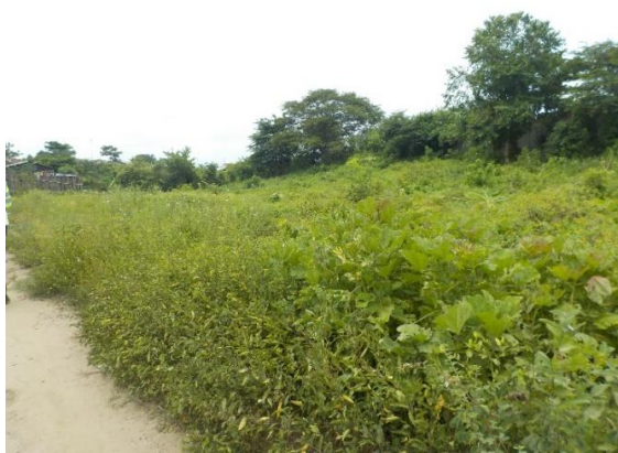
Imagen 2. Vista del predio