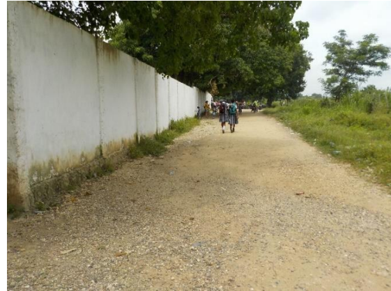
Imagen 3. Vista del predio