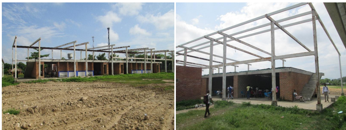
Imagen 1. Estado actual de la infraestructura