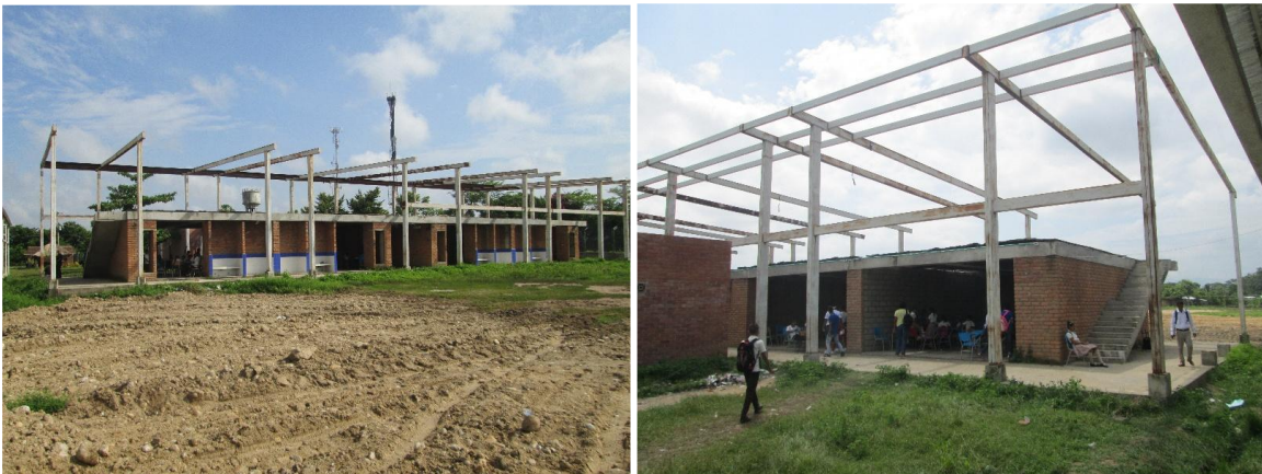
Imagen 2. Estado actual de la infraestructura

El proyecto corresponde a una obra construida en el año 2013, la cual cuenta con Licencia de Construcción mediante resolución No. 03-08-2012 del 3 de agosto de 2012. El proyecto corresponde a la construcción de cuatro (4) aulas de clases multifuncionales y dos (2) soluciones sanitarias.