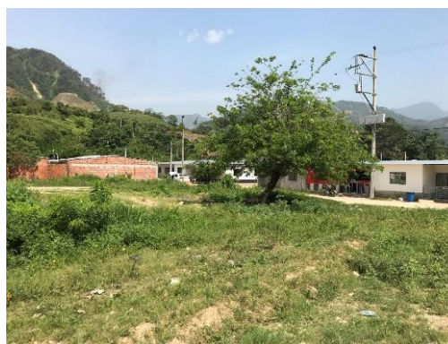
Imagen 2. Vista del predio