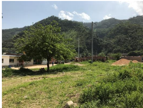
Imagen 2. Vista del predio