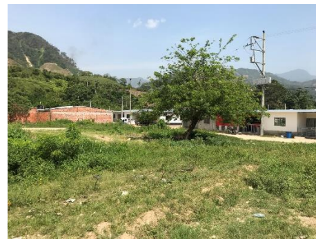
Imagen 3. Vista del predio