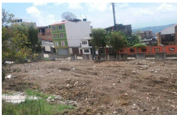
Imagen 2. Vista del predio