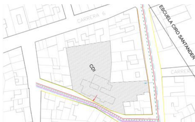
Imagen 1. Localización del predio