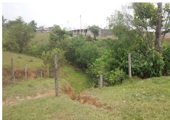
Imagen 2. Vista del predio