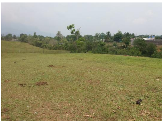
Imagen 1. Vista del predio