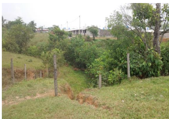
Imagen 2. Vista del predio