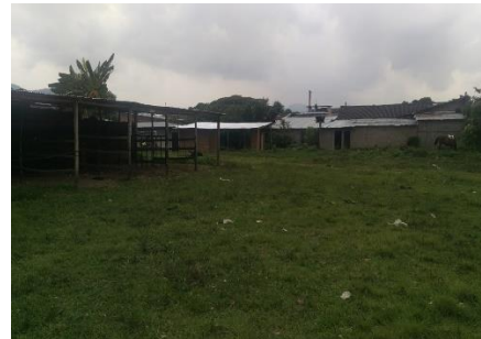
Imagen 2. Vista del predio