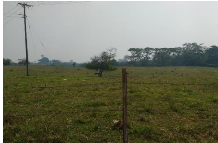
Imagen 3. Vista del predio