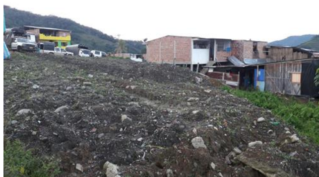
Imagen 3. Predio del proyecto