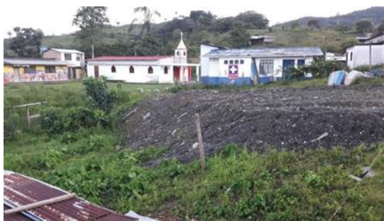
Imagen 1. Vista frontal del lote