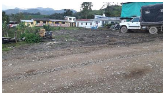
Imagen 2. Entrada al predio del proyecto