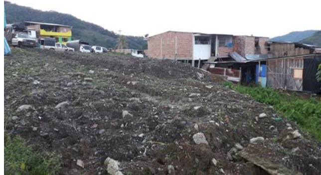
Imagen 3. Predio del proyecto