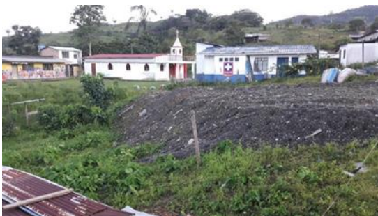
Imagen 1. Vista frontal del lote