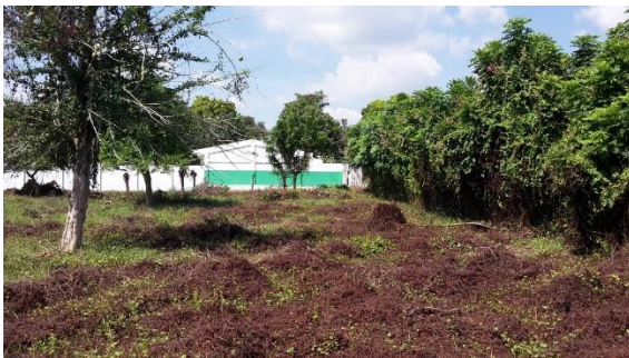
Imagen 1. Vista general del lote

El lote en el cual se desarrollará el proyecto corresponde al predio con matrícula inmobiliaria N° 347-78736 de propiedad del Municipio de San Pedro, con un área aproximada de 2.400 m 2 .