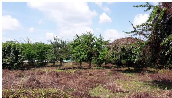
Imagen 2. Vista general del lote