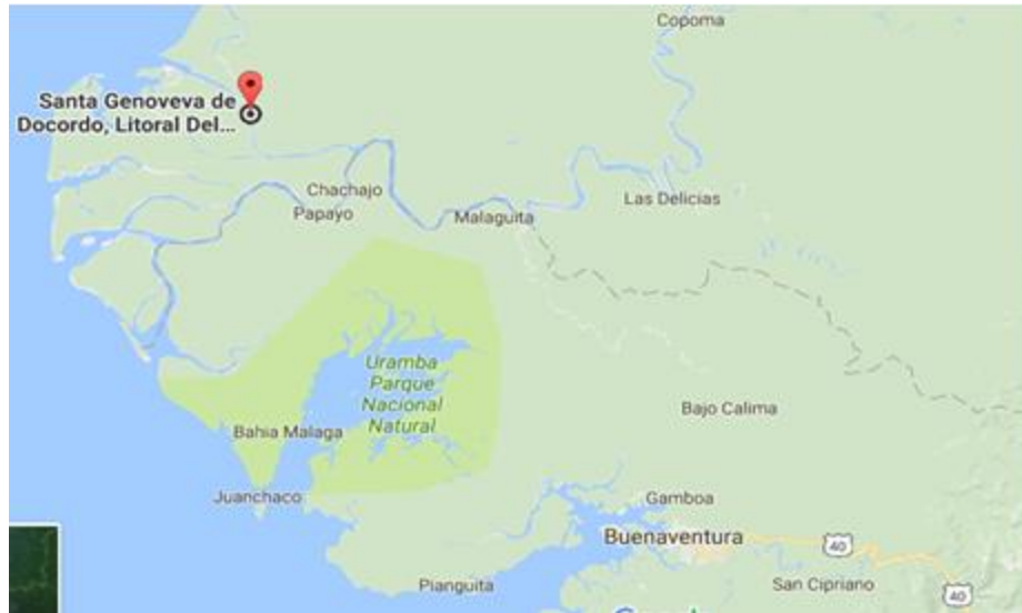
Figura 2. Localización Municipio de Litoral del San Juan

El predio está ubicado al costado de la alcaldía de Docordó con acceso a través de vía peatonal en zona administrativa de la cabecera municipal. El lote en el cual se desarrollará el proyecto corresponde al predio con matrícula inmobiliaria No. 184-14227 de propiedad del municipio de Litoral de San Juan, con un área aproximada de 780 m2.