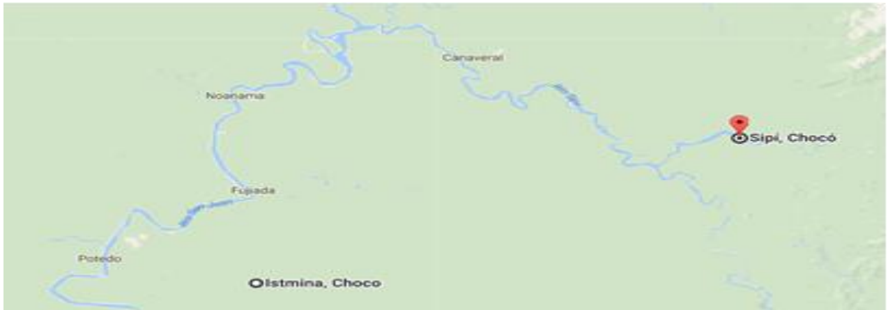
Figura 1. Localización Municipio de Sipí

El predio está ubicado en la zona administrativa del municipio de Sipí en el barrio Polideportivo contiguo al centro de atención a víctimas y al Centro de infancia y familia. El lote en el cual se desarrollará el proyecto corresponde al predio con matrícula inmobiliaria No. 184-11277 de propiedad del municipio de Sipí, con un área aproximada de 600 m 2 .