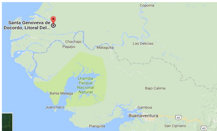
Figura 2. Localización Municipio de Litoral del San Juan