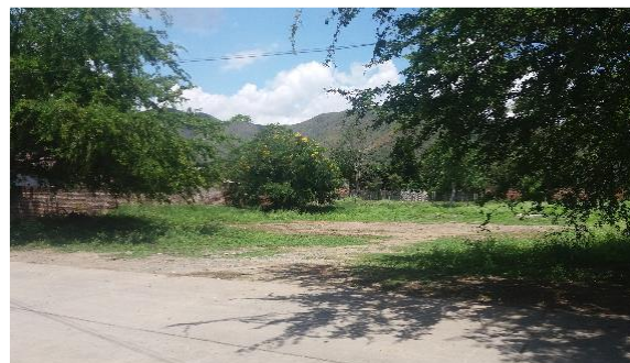
Imagen 2. Entrada al predio del proyecto