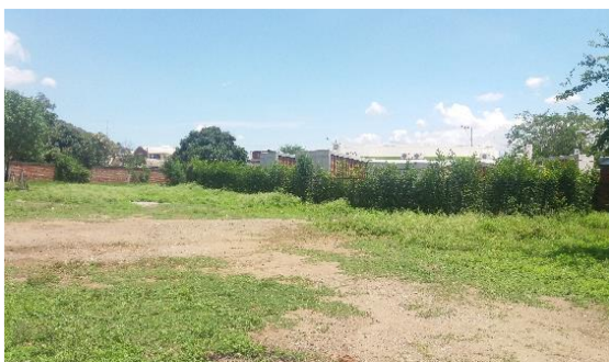
Imagen 1. Vista frontal del lote