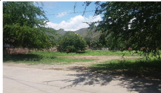
Imagen 2. Entrada al predio del proyecto