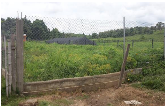
Imagen 1. Entrada al predio del proyecto