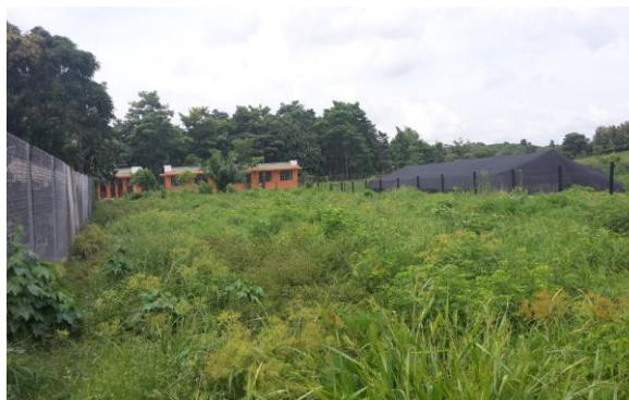
Imagen 2. Vista frontal del lote