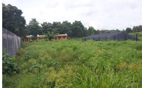
Imagen 2. Vista frontal del lote