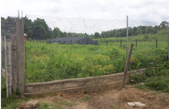
Imagen 1. Entrada al predio del proyecto