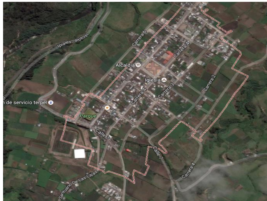
Figura 1. Localización Predio para la construcción del CDI