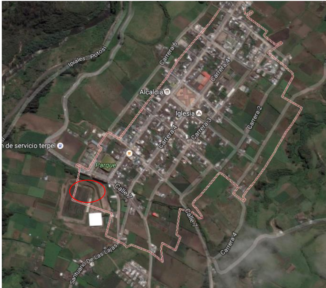
Figura 1. Localización Predio para la construcción del CDI

Ubicación del Lote: El lote en el cual se desarrollará el proyecto corresponde al predio con matrícula inmobiliaria N° 244-47440 de propiedad del Municipio de Potosí, con un área aproximada de 3.500 m 2 .