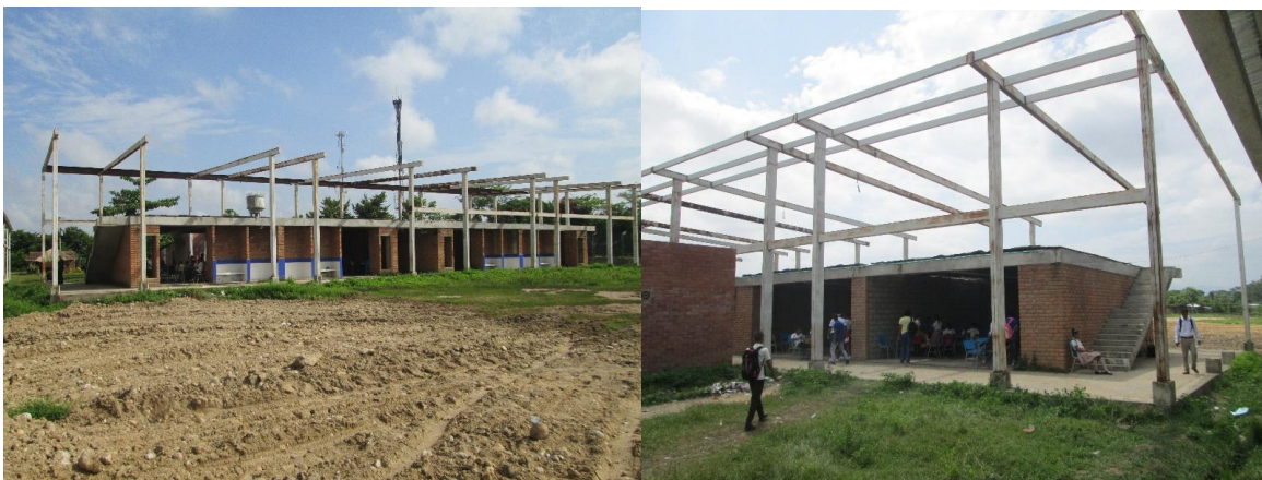
Imagen Estado actual de la Infraestructura