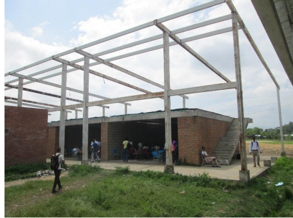
Imagen Estado actual de la Infraestructura