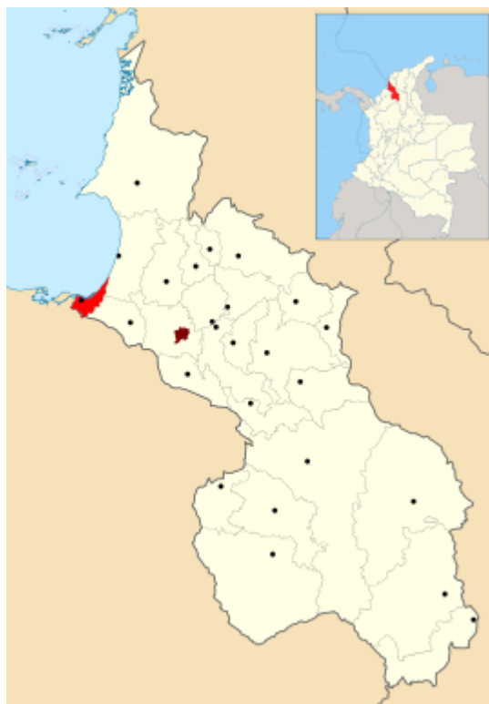
Figura 1. Ubicación geográfica del municipio de Coveñas en el Departamento de Sucre.

No existe acceso mediante transporte marítimo comercial ni de pasajeros y los muelles existentes solamente son utilizados para las actividades de las empresas petroleras y de la Armada Nacional.