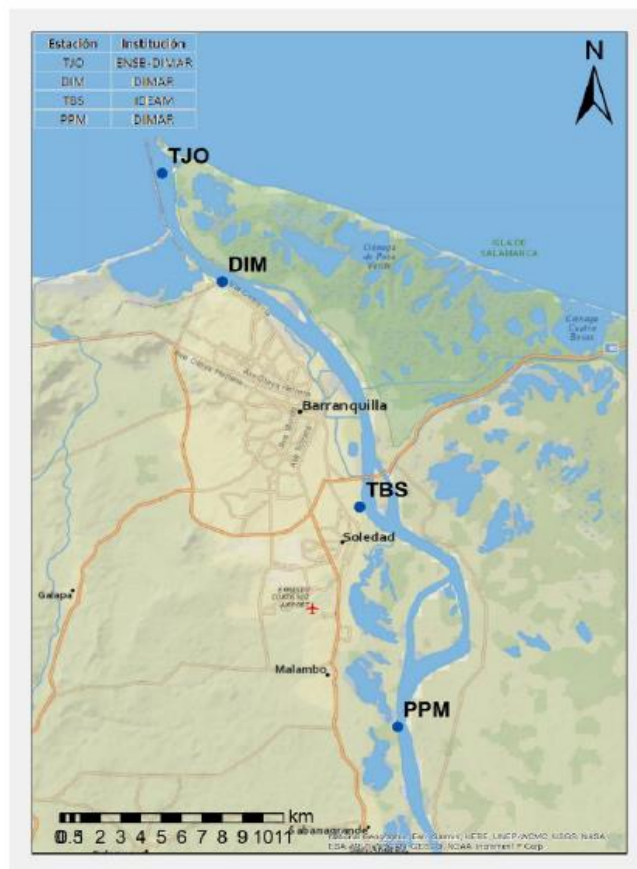
Figura. Distribución espacial estaciones permanentes para el registro del nivel de agua

Para la gestión y control de las obras de dragado y las mediciones asociadas que realizarán tanto el contratista dragador como el interventor por medio de levantamientos batimétricos predragado, postdragado y de seguimiento y control, deberá utilizar el Datum Vertical LW y Red Hidrográfica (Figura). En consecuencia, tanto EL CONTRATISTA como EL INTERVENTOR, deberán realizar mediante una comisión topográfica la verificación del datum establecido por DIMAR y ajustarlo al instrumento de medición que utilicen para nivel de agua durante la ejecución de sus trabajos, es decir amarrar los mareógrafos con los levantamientos batimétricos que realice el Contratista-dragador. Sobre este nivel de referencia, se harán los cálculos para la determinación del volumen finalmente dragado