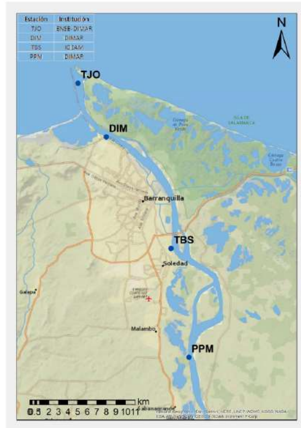
Figura 2. Distribución espacial estaciones permanentes para el registro del nivel de agua

Adicional a lo anterior, las batimetrías de predragado y de postdragado realizadas por el contratista, deben ser realizadas con equipos de medición distintos a los empleados por el interventor.