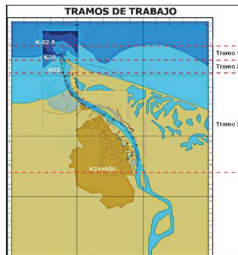
Figura 1. Tramos de Trabajo del canal navegable

En este tramo se localizan las zonas de giro las cuales serán intervenidas mediante dragado denominadas: Prado, Paraíso y Barrio Abajo con geométricas específicas según plano adjunto. La siguiente figura presenta la localización de los tramos mencionados: