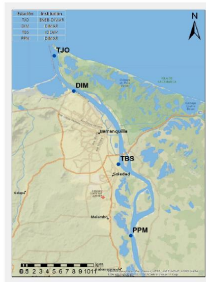
Figura. Distribución espacial estaciones permanentes para el registro del nivel de agua

Adicional a lo anterior, las batimetrías de predragado y de postdragado realizadas por el contratista, deben ser realizadas con equipos de medición distintos a los empleados por el interventor.