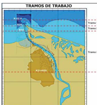
Figura 1. Tramos de Trabajo del canal navegable

En este tramo se localizan las zonas de giro las cuales serán intervenidas mediante dragado denominadas: Prado, Paraíso y Barrio Abajo con geométricas específicas según plano adjunto. La siguiente figura presenta la localización de los tramos mencionados: