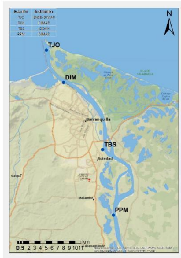
Figura 2. Distribución espacial estaciones permanentes para el registro del nivel de agua

Adicional a lo anterior, las batimetrías de predragado y de postdragado realizadas por el contratista, deben ser realizadas con equipos de medición distintos a los empleados por el interventor.