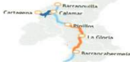
Figura 2 (Localización Tramo previsto de Dragado - Color Naranja)

CLÁUSULA DÉCIMA TERCERA. - CLÁUSULA LUGAR DE EJECUCIÓN: La localización del proyecto se encuentra definida en el numeral 1.3 de los Términos de Referencia y en los términos definidos en la descripción del objeto del presente CONTRATO . Los trabajos de dragado para el mantenimiento del canal navegable en el Río Magdalena se desarrollarán en el sector comprendido entre Barrancabermeja (Santander) y Pinillos (Bolívar), en los sitios que de acuerdo con la dinámica del río evidencien acumulaciones de sedimentos que disminuyan la profundidad requerida y dificulten la navegación en este sector.