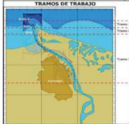
Figura 1. Tramos de Trabajo del canal navegable

La siguiente figura presenta la localización de los tramos mencionados: