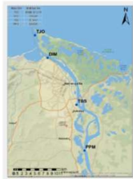
Figura. Distribución espacial estaciones permanentes para el registro del nivel de agua

Para la gestión y control de las obras de dragado y las mediciones asociadas que realizarán tanto el contratista dragador como el interventor por medio de levantamientos batimétricos predragado, postdragado y de seguimiento y control, deberá utilizar el Datum Vertical LW y Red Hidrográfica. En consecuencia, tanto EL CONTRATISTA como EL INTERVENTOR, deberán realizar mediante una comisión topográfica la verificación del datum establecido por DIMAR y ajustarlo al instrumento de medición que utilicen para nivel de agua durante la ejecución de sus trabajos, es decir amarrar los mareógrafos con los levantamientos batimétricos que realice el Contratista-dragador. Sobre este nivel de referencia, se harán los cálculos para la determinación del volumen finalmente dragado.