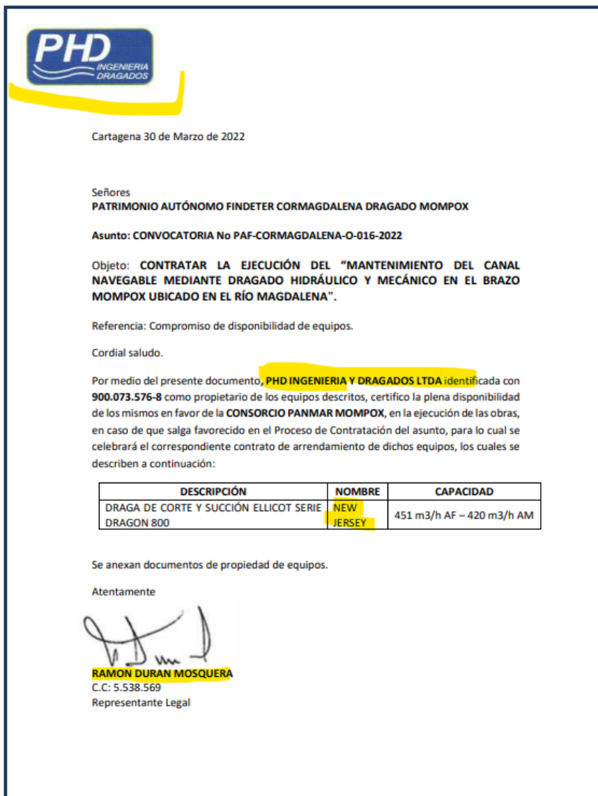
Ilustración 2. Fragmento de Propuesta del CONSORCIO PANMAR MOMPOX

Por lo tanto, en vista de estos hechos evidentes y que los mismos corresponden a un fraude procesal probado y fraude en documento público y privado, pondremos en conocimiento a los entes de control que velan porque los procesos Licitatorios se celebren y se rijan bajo la aplicación de los principios de la contratación estatal; Principio de Transparencia, Planeación, economía, responsabilidad, libre concurrencia y de escogencia objetiva.