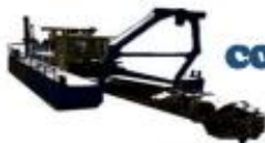
Ilustración 1. Fragmento de Propuesta del CONSORCIO PANMAR MOMPOX