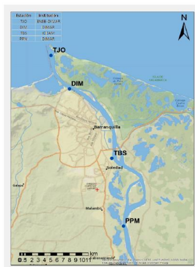
Figura 2. Distribución espacial estaciones permanentes para el registro del nivel de agua

Para la gestión y control de las obras de dragado y las mediciones asociadas que realizarán tanto el contratista dragador como el interventor por medio de levantamientos batimétricos predragado, postdragado y de seguimiento y control, deberá utilizar el Datum Vertical LW y Red Hidrográfica. En consecuencia, tanto EL CONTRATISTA como EL INTERVENTOR, deberán realizar mediante una comisión topográfica la verificación del datum establecido por DIMAR y ajustarlo al instrumento de medición que utilicen para nivel de agua durante la ejecución de sus trabajos, es decir amarrar los mareógrafos con los levantamientos batimétricos que realice el Contratista-dragador. Sobre este nivel de referencia, se harán los cálculos para la determinación del volumen finalmente dragado