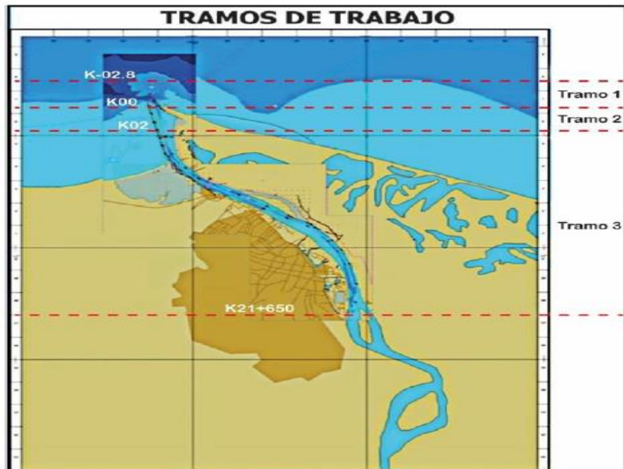
Figura 1. Tramos de Trabajo del canal navegable

La siguiente figura presenta la localización de los tramos mencionados: