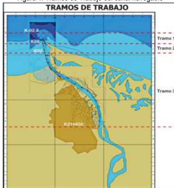
Figura 1. Tramos de Trabajo del canal navegable

La siguiente figura presenta la localización de los tramos mencionados: