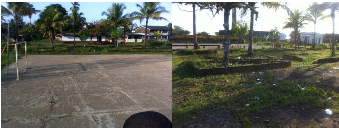
Figura 3 y 4. Imágenes del Predio