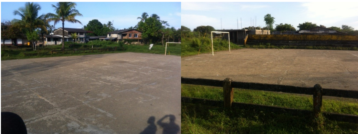
Figura 1 y 2. Imágenes del Predio