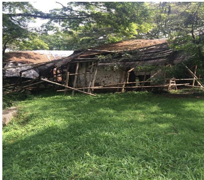
Figura 2. Imagen del Trapiche, 8 de marzo de 2016.