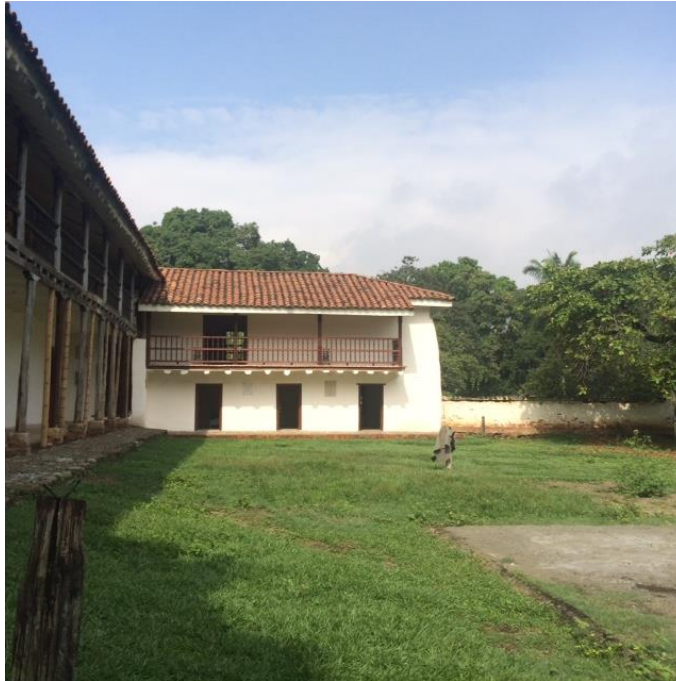
Figura 1. Imagen de la Casona, tomada por FINDETER, 8 de marzo de 2016.