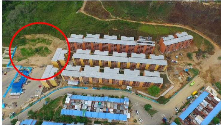
Figura 06. Predio para Biblioteca en Urbanización Campo Madrid