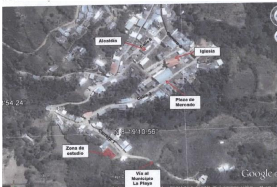
Figura. Localización Predio Biblioteca.