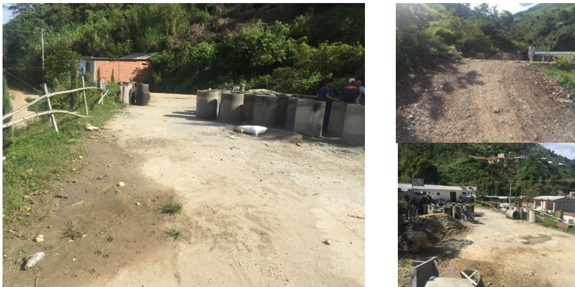
Figura. Estado del Lote de Terreno – Casco Urbano.